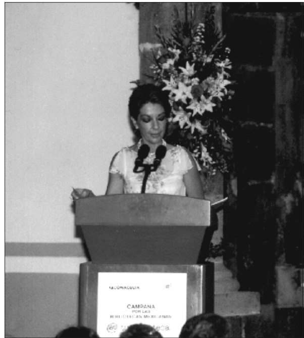
Marta Sahagún de Fox, presidenta honoraria de la Campaña por las Bibliotecas Mexicanas.

Agregó que, por ello mismo, el eje focal del Programa Nacional de Cultura 2001-2006 es promover la lectura, fuente del conocimiento, y paralelamente abrir oportunidades de educación aprovechando las ventajas tecnológicas.