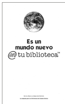
Ejemplo de promocional de la Campaña para las bibliotecas de Estados Unidos

Sabiendo que la promoción es el mejor medio para integrar a la comunidad con la biblioteca y para que ésta participe activamente en el desarrollo social y cultural, invita a todos sus miembros a hacer uso de los servicios, mediante carteles, anuncios, trípticos, volantes, etcétera.