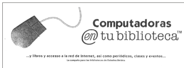
Ejemplo de promocional de la Campaña para las bibliotecas de Estados Unidos